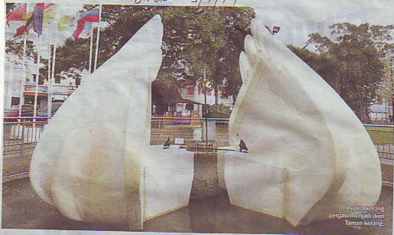
Rep. Kerang bergasi menjadi ikon Taman Kerang.